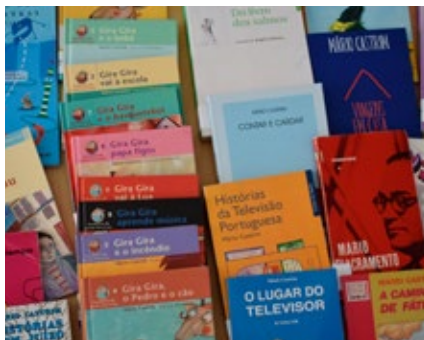
BIBLIOTECA MUNICIPAL DE ÍLHAVO