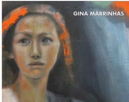
BIBLIOTECA MUNICIPAL DE ALBERGARIA-A-VELHA