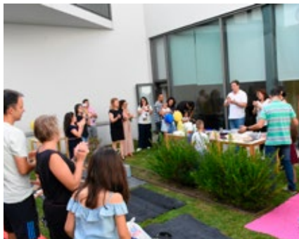
BIBLIOTECA MUNICIPAL DE ÍLHAVO

Horário(s) 16h00-17h00 Público-alvo Famílias