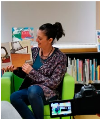
BIBLIOTECA MUNICIPAL DE ANADIA