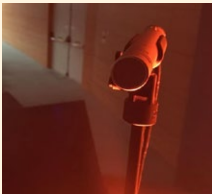
BIBLIOTECA MUNICIPAL DE ESTARREJA

Horário 11h00 Local Promotor Município de Vagos Público-alvo Infantil/ juvenil