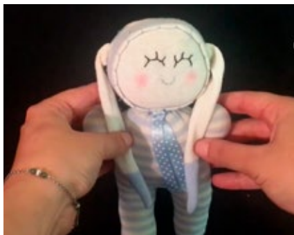
BIBLIOTECA MUNICIPAL DE ESTARREJA

Promotor Município de Anadia Público-alvo Crianças dos 3 aos 10 anos