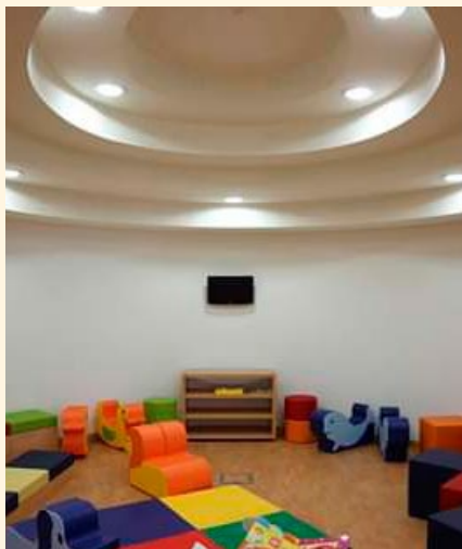
BIBLIOTECA MUNICIPAL JOÃO GRAVE – VAGOS