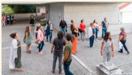
BIBLIOTECA MUNICIPAL MANUEL ALEGRE – ÁGUEDA

A Hora do Conto é um programa de promoção da leitura que tem por objetivo despertar nas crianças o gosto pela leitura.