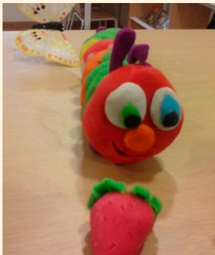
BIBLIOTECA MUNICIPAL JOÃO GRAVE – VAGOS