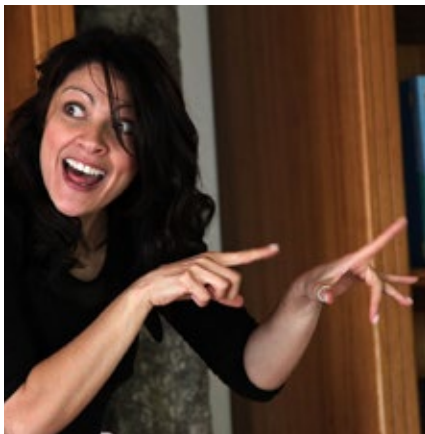
BIBLIOTECA MUNICIPAL DE SEVER DO VOUGA