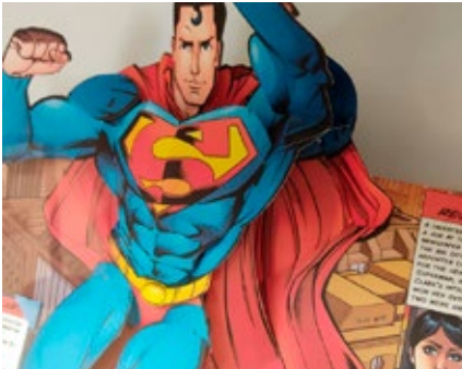
BIBLIOTECA MUNICIPAL DE OVAR