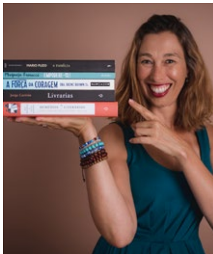
BIBLIOTECA MUNICIPAL DE SEVER DO VOUGA