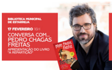
BIBLIOTECA MUNICIPAL DE ESTARREJA

Horário(s) 15h00 Público-alvo Crianças a partir dos 3 anos