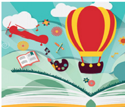
BIBLIOTECA MUNICIPAL JOÃO GRAVE – VAGOS