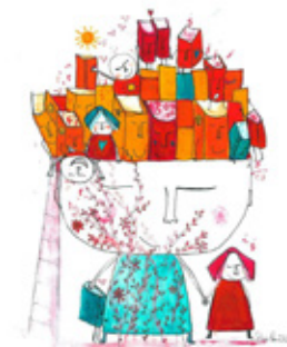
BIBLIOTECA MUNICIPAL DE SEVER DO VOUGA