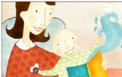
BIBLIOTECA MUNICIPAL JOÃO GRAVE – VAGOS

Público-alvo Famílias, Professores, Educadores e Profissionais de Saúde