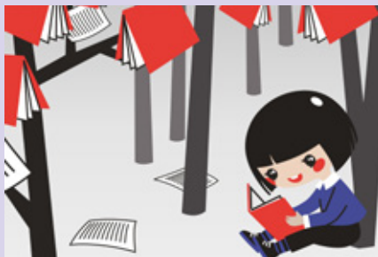
BIBLIOTECA MUNICIPAL DE ALBERGARIA-A-VELHA