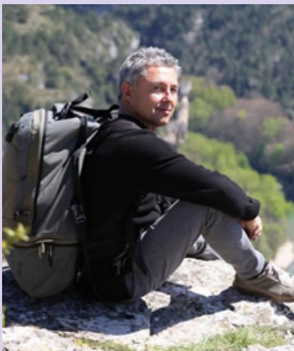
BIBLIOTECA MUNICIPAL DE OVAR