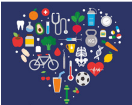
BIBLIOTECÁ MUNICIPAL DE OLIVEIRA DO BAIRRO

13 E 27 DE JANEIRO, 10 E 24 DE FEVEREIRO, 03 E 17 DE MARÇO