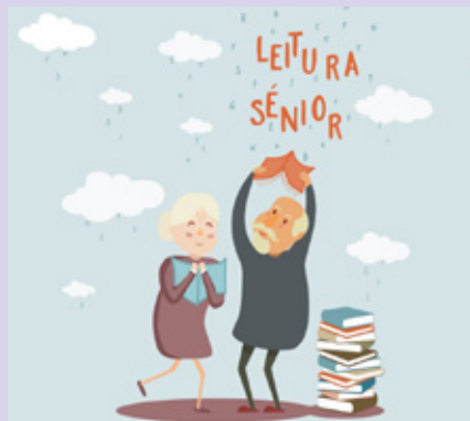
BIBLIOTECA MUNICIPAL DE OLIVEIRA DO BAIRRO

Horário(s) 14h30 Público-alvo Alunos e professores do secundário e público em geral.