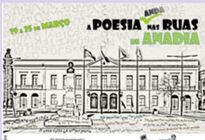
BIBLIOTECA MUNICIPAL DE ANADIA

Professores da Educação Pré-Escolar, do Ensino Básico, do Ensino Secundário e do Ensino Especial, e Professores Bibliotecários Designados ao Abrigo da Portaria 192-A/2015 – Formação em Acreditação Animadores | Bibliotecários – Certificado de Participação