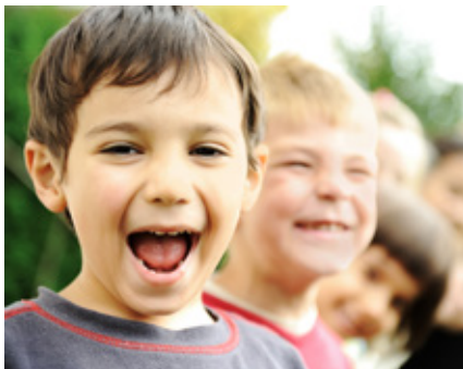
BIBLIOTECA MUNICIPAL DE ALBERGARIA-A-VELHA